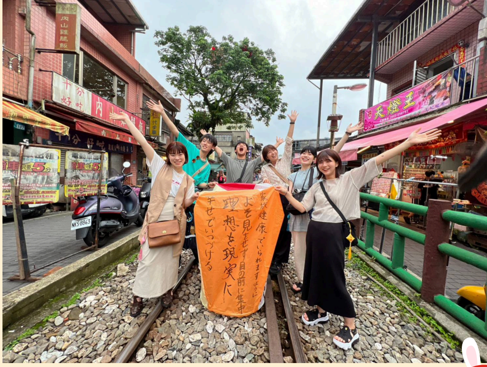
↑台湾留学中に遊びに来てくれた大学の同期と九份で