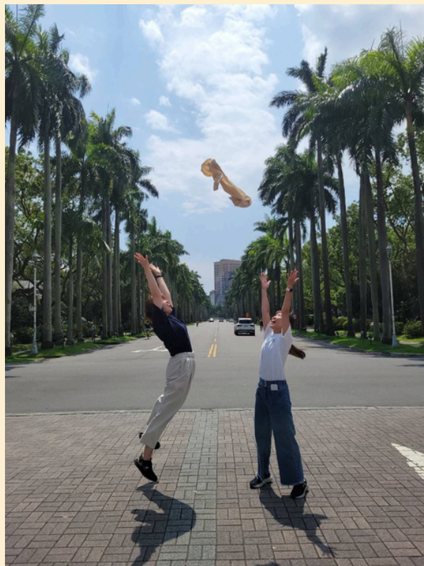
台湾大学内にある有名な通りで留学終了を祝って友達と