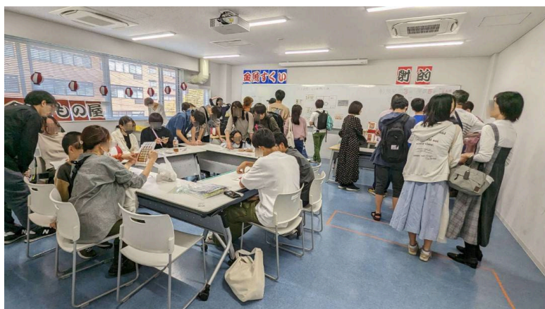
↑ 学園祭での謎解き企画の様子