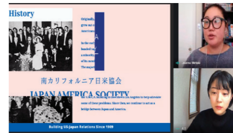
【国際関係】国際交流 NPO