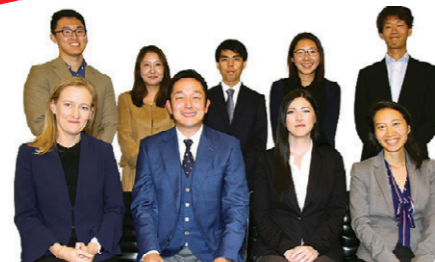
【サービス】会計事務所