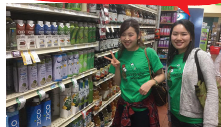
【製造・輸出入】輸入販売