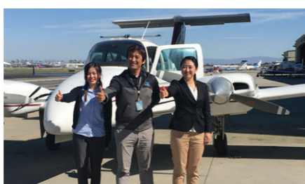
【教育 x 航空関連】フライトスクール