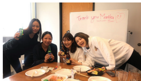
【メディア】出版・広告